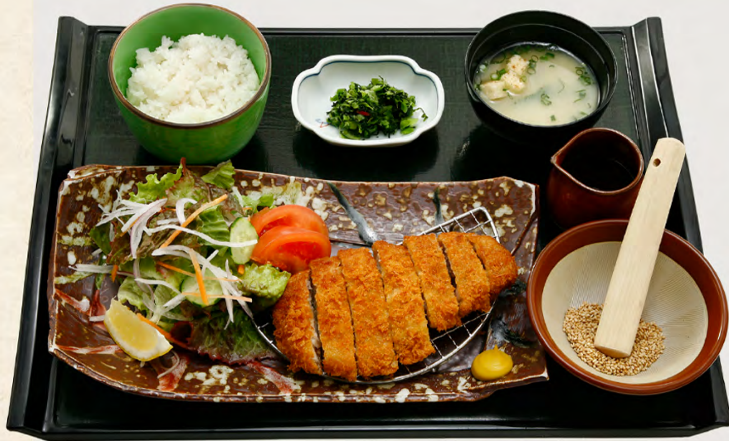
鹿児島黒豚 ローズカツ膳